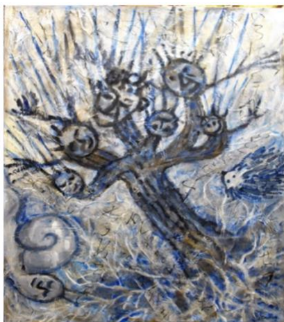
2014 ARBRE DE FAMILLE 116h x 89lcm MIXTE SUR TOILE Kaoru TSUZAWA

Après avoir lu le livre de Masanobu Fukuoka, j'ai eu l'impression que le contenu du livre relève du domaine spécialisé de l'agriculture.