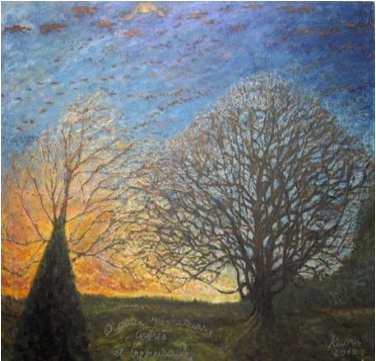
2010 CREPUSCULE ET LES MIGRATEURS HUILE SUR TOILE 160hx 128lcm Kaoru Tsuzawa