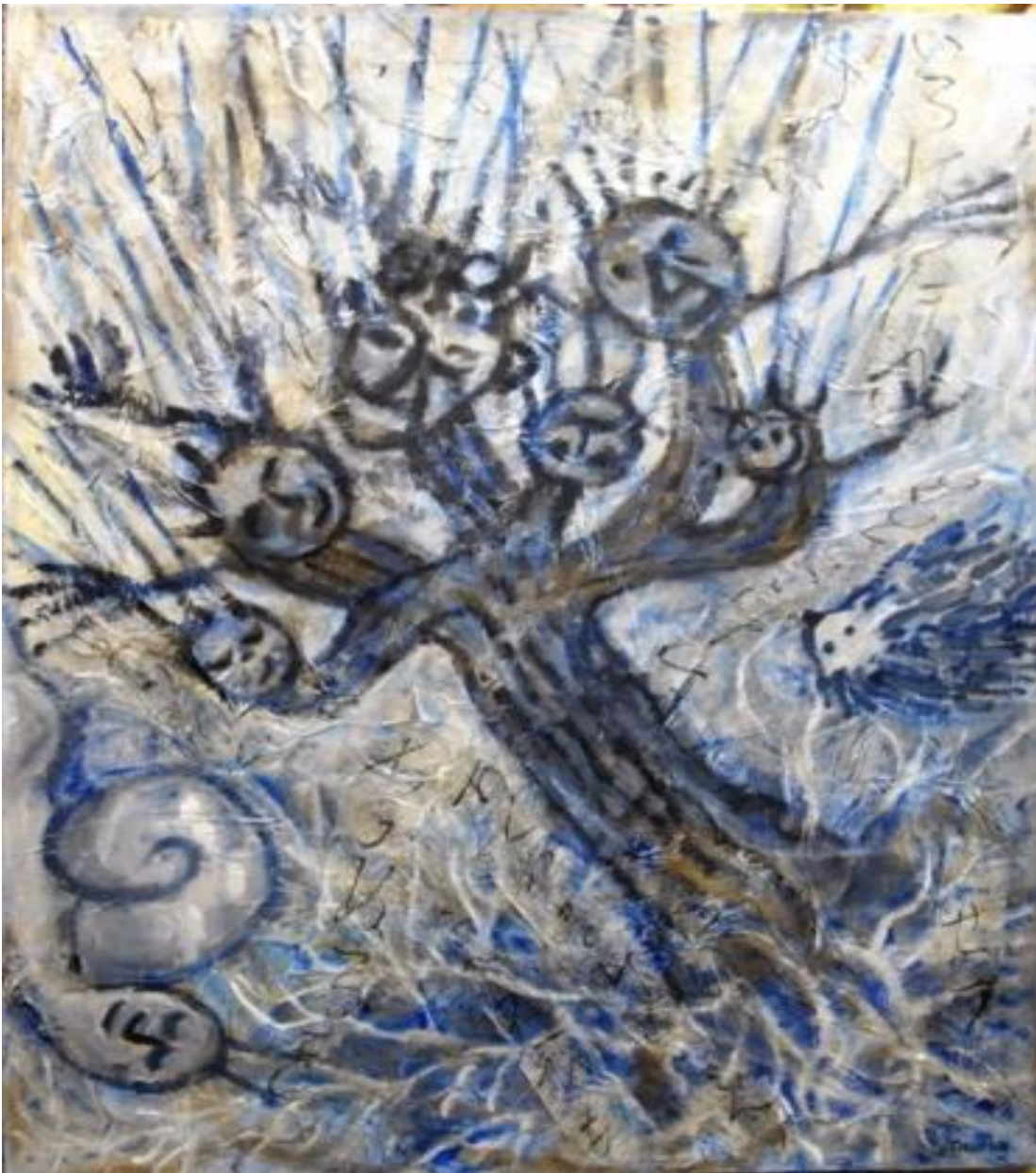
2014 ARBRE DE FAMILLE 116h x 89lcm MIXTE SUR TOILE Kaoru TSUZAWA