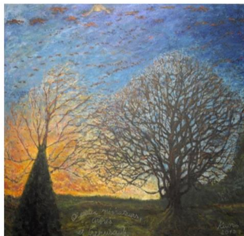
2010 CREPUSCULE ET LES MIGRATEURS HUILE SUR TOILE 160hx 128lcm Kaoru Tsuzawa

En d'autres termes, les créateurs fascinés par les nouvelles techniques et les modes sont un peu comme les agriculteurs qui investissent dans des machines agricoles, améliorent artificiellement les terres que la nature leur a données, cultivent des céréales et ne recherchent que le profit.